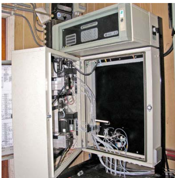
De twee stuks oude natchemische analysers zijn vervangen