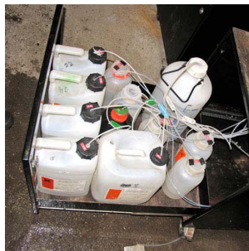
Natchemische analysers vergen veel chemicaliën en onderhoud