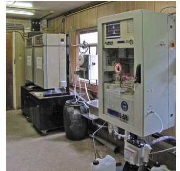
De nieuwe Quick-TOC/TN b analyser