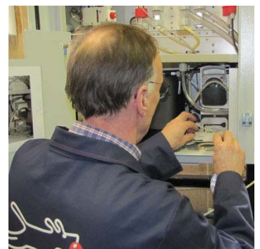
De Quick-TOC/TN b is gemakkelijk toegankelijk voor service