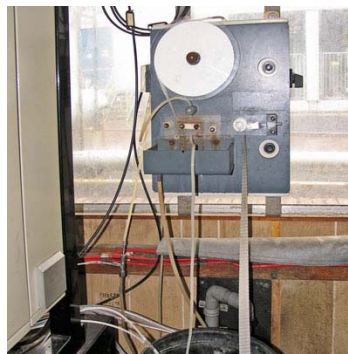
Ook het bandfilter is voor de Quick-analyser niet meer nodig