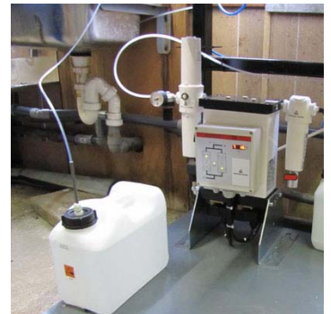
Er is enkel demin water en CO 2 -vrije lucht benodigd