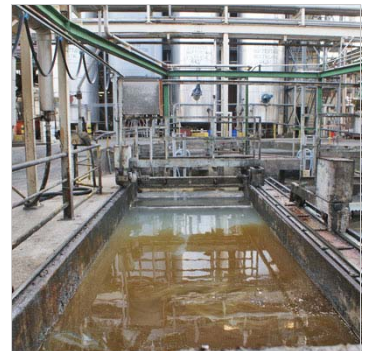
Via olieafscheiders en vetvangsers wordt het afvalwater afgeroomd

De nieuwe TOC-analyser meet het binnenstromende ongereinigde afvalwater. Het is een zogenaamde True TOC-analyser. Het gebruik van deeltjesfilters is overbodig. Het procesmonster wordt direct, inclusief de organische (vet)deeltjes, geïnjecteerd en bij 1200 °C. thermisch verbrand. Na iedere monsterinjectie wordt het injectiesysteem gespoeld met deminwater. Er is door het bedrijf gekozen voor de Total Carbon techniek. Bij deze methode worden geen chemicaliën zoals zuren gebruikt. Deze Quick-TC analyser is uitgevoerd als 2-strooms analyser en bewaakt zodoende beide influentstromen met een analysefrequentie van 3 minuten. De procesmonsters die deze Quick-TOC analyseert zijn sterk verontreinigd. Echter, door toepassing van de speciale injectietechniek en spoeltechniek is het onderhoud gering.