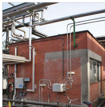
Het analysehuis met fast sample loop en box met appendages