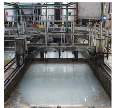
De waterbehandeling gebeurt met twee parallelle systemen