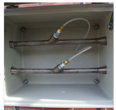
Monstereextractie via anti-isokinetische monsternam