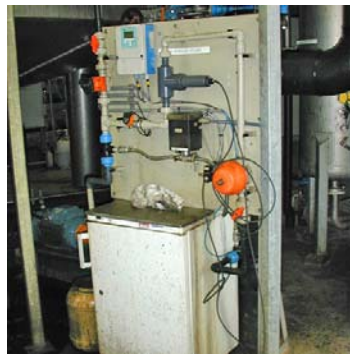
Een monsternamelocatie met heel veel leidingen, bochten en afsluiters.