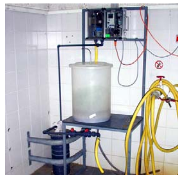
Het monster wordt bewaard in een niet gekoeld vat. Horizontale gedeelten in de aanvoerleiding.