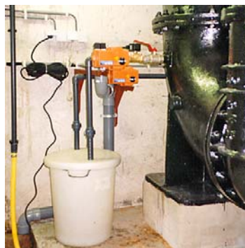
Zo deden we dat vroeger. Via een bypass en kogelkraan monsternamen uit een joekel van een leiding. Het monster werd hier nog niet gekoeld bewaard.