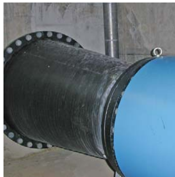
Het uitlooptrajct na de MID-meter ontbreekt. Een verloop is direct achter de meter geplaatst. 2 a 3-D en dan verlopen zou eleganter zijn geweest.