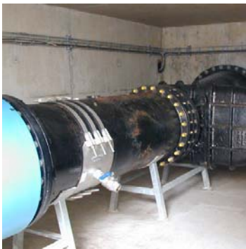
Een grote MID-meter op een RWZI past met goed fatsoen niet in de kelder. Het inlooptrajct is onvoldoende lang en direct ervoor zorgt een afsluiter voor een verstoorde stromingsprofiel met als resultaat een grote meetfout.