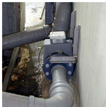
Deze MID meter, in verzopen opstelling, bleek de dubbele waarde te meten omdat de meter verstopt was met visgraten (laagste punt). Zorg voor een krachtige doorstroming. In een vrij verval situatie is dat niet altijd mogelijk