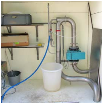
Monstername via een op tijdbasis gestuurd magneetventiel. Een MID meter met een te kort inlooptrajct, direct achter een bocht.