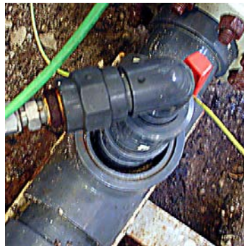
Monsteraanvoer via een bypass op de hoofdleiding. Isokinetische monstername is hier niet aan de orde.