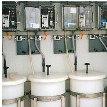
Wederom ongekoelde vaten met schudwerken. Wat waren we vroeger trots op dit project. Alles is thans omgebouwd via gebruik van Jumbo's.