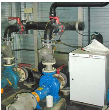
Twee perspompen, twee horizontale leidingen en een huis-tuin-en-kuiken koelkast.... Zo kan het ook.