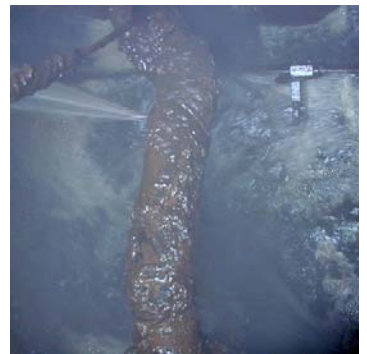
Een lekke persleiding in een put. Het spuit eruit! Polyethyleen is wellicht een betere oplossing, het corrodeert niet weg.