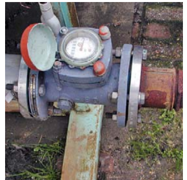
Men poogt wel eens een goedkope mechanische watermeter te gebruiken als afvalwatermeter. Dat is geen goed idee. De meter zal snel vervuilen.